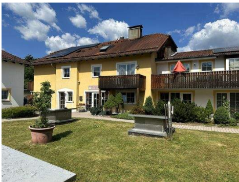
Mitten im Feriendorf