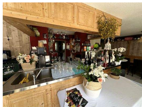
Theke mit Bierzapfanlage