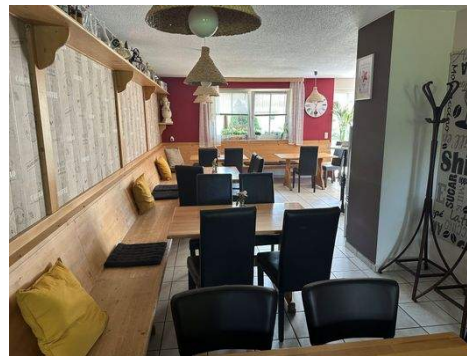
Gastraum von Terrasse fotografiert