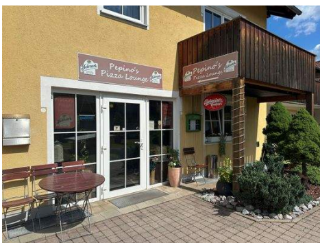
Willkommen, liebe Gäste!