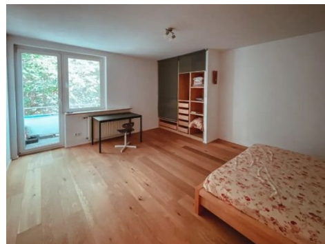
Schlafen mit Balkon