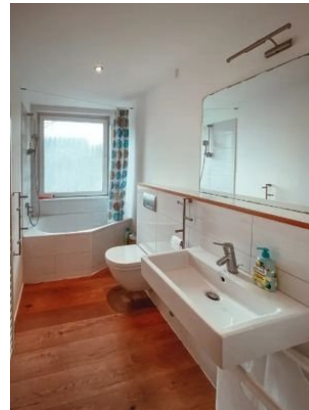
Bad mit Fenster