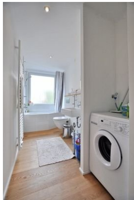
Bad mit Waschmaschine