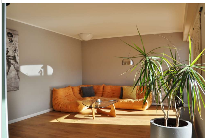
Wohnen mit viel Licht