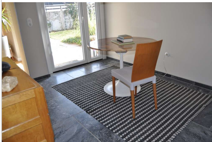
Essplatz mit Gartenblick